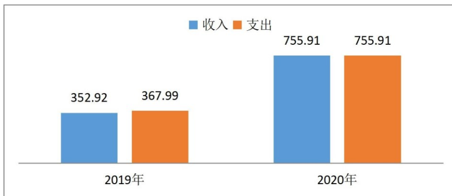
2019-2020 年收支总计对比情况（图 1）

本部门 2020 年度收、支总计（含结转和结余）755.91 万元（其中收入包含财政拨款收入 736.44 万元和 2019 年结转资金 19.47 万元）。与 2019 年度决算相比，收支各增加 402.99 万元和 387.92 万元，增长 114.2% 和 105.4%，主要原因是老干部局和原老干部二局财务独立核算，2020 年度老干部局和原老干部二局财务合并决算。