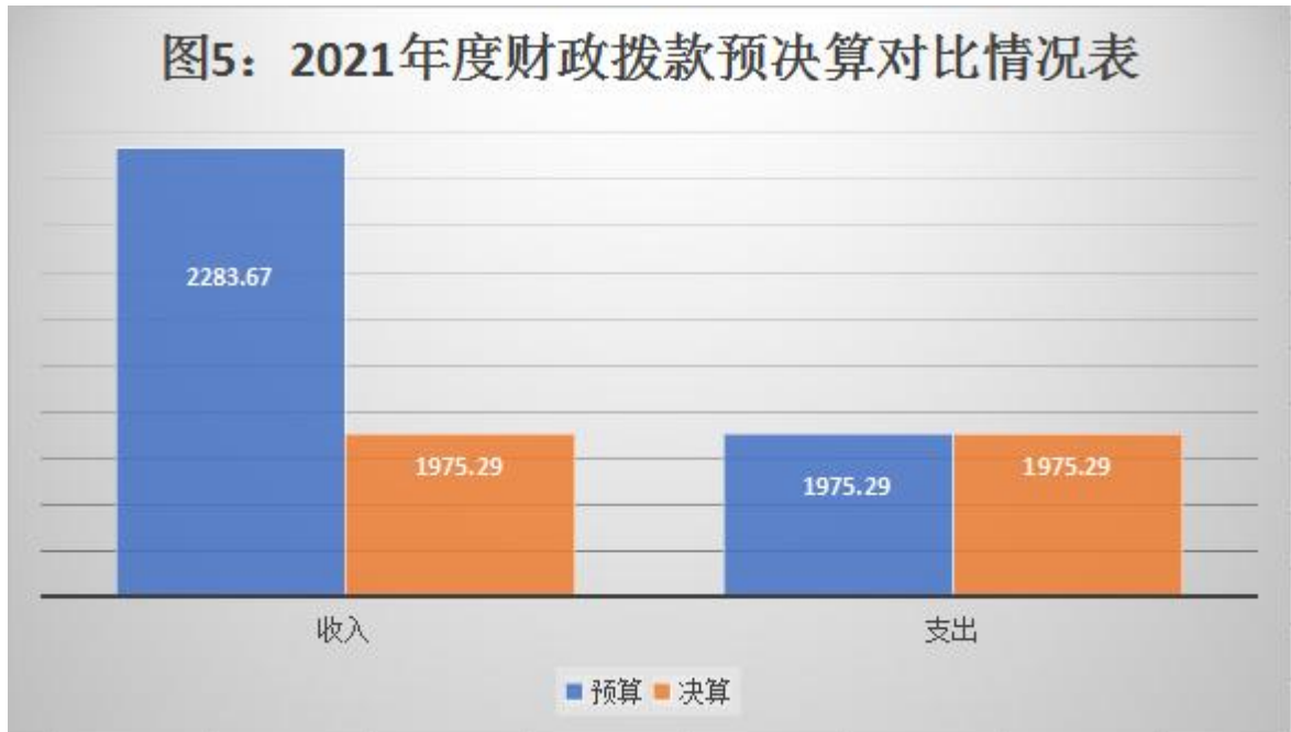
图5：2021年度财政拨款预决算对比情况表